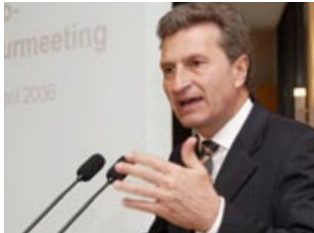
Ministerpräsident Günther H. Oettinger

stellten die aktuellen Ergebnisse des Frühjahrsgutachtens und Daten zur Konjunktur in Baden-Württemberg vor. Die Prognose für Deutschland rechnet im Jahresdurchschnitt mit einer Zunahme der gesamtwirtschaftlichen Produktion um 1,8%. Damit wäre der kräftigste Anstieg des realen Bruttoinlandsprodukts seit 2000 erreicht. Starke Impulse kommen