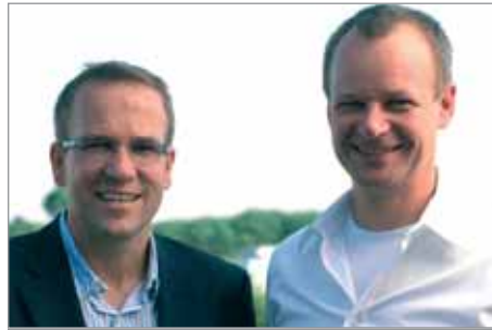
Netviewer GmbH, Karlsruhe

► Mehr Informationen unter www.landespreis-bw.de