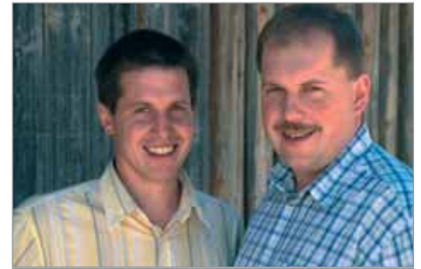
Gebrüder C. u. G. Maier GmbH & Co. KG, Isny

Mit der Software von Netviewer können Geschäftspartner auch über große räumliche Distanzen gemeinsam an Dokumenten arbeiten. Das geht via Internet und ganz ohne aufwendige technische Installationen.