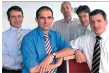
Transporeon GmbH & Co. KG, Ulm

Mit den innovativen Komponenten für Biogasanlagen von den Gebrüder Maier können "Strombauern" ihre Anlagen statt mit Gülle, direkt mit Pflanzen betreiben.