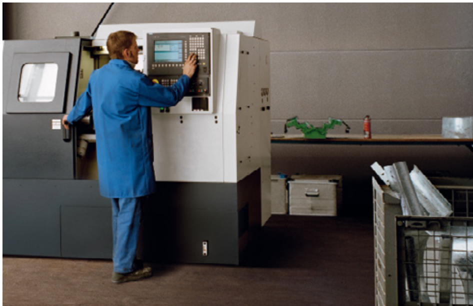
Finanzierungsbeispiel: eine CNC-Drehmaschine

in den letzten Monaten finanziert wurden, ist es gelungen, die gesamte Breite des Mittelstands zu erreichen. Das Programm finanziert Projekte jeder Größenordnung, Vorhaben mit Kosten unter 100.000 Euro ebenso wie Millioneninvestitionen. Gefördert wurden bisher beispielsweise Unternehmen bei der Anschaffung einer CNC-Drehmaschine oder eines Hochleistungsschweißblasers. Aber auch der Bau eines Sägewerks wurde mit Hilfe der Technologieförderung finanziert.