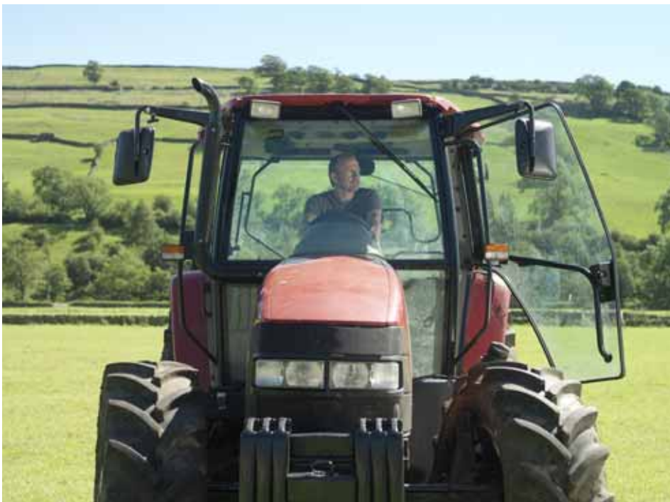
Im ländlichen Raum Baden-Württembergs findet man beides: Agrarwirtschaft und Hochtechnologie.

Vor allem jetzt, da durch die Finanzkrise die Aufnahme langfristiger Kredite erschwert ist, sind diese Angebote besonders wichtig. Sie schaffen zusätzliche Spielräume gerade auch für Unternehmen, deren Bonität schwächer geworden ist, denn für sie werden die Kredite teurer. Die beiden Konjunkturpakete des Bundes werden hier auf Länderseite flankiert: Baden-Württemberg hat den Bürgschaftsrahmen auf 1,2 Milliarden erhöht. Die L-Bank hat – wie andere regionale Förderinstitute auch – ihr Angebot für den Mittelstand der schwierigen Situation angepasst.