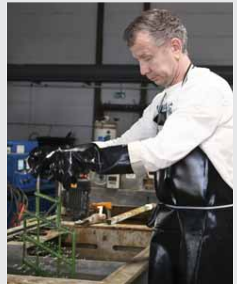
In der Regel werden die Oberflächen in vollautomatischen Verfahren haltbar gemacht; das Säurebad von Hand ist die Ausnahme.

So hat Schweizer mit Unterstützung des Programms „Gründungs- und Wachstumsfinanzierung“ die alte Produktionsanlage und das alte Bürogebäude abgerissen und neu aufgebaut. Neben den günstigen Konditionen schätzt er weitere Vorteile: „Die ersten drei Jahre sind tilgungsfrei; in guten Jahren hat man ja dann schon Erträge aus den Investitionen und kann daraus die Rückzahlung zum Teil finanzieren.“ Auch kam dem Unternehmen die Haftungsfreistellung