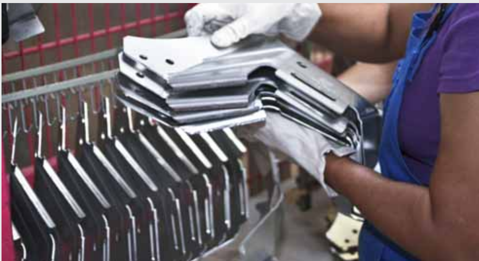
Bearbeitet werden ganz unterschiedliche Metallteile: von der Skibindung bis zum Autoteil.

zugute, mit der die gewährten Darlehen teilweise ausgestattet sind. Diese werden dann ähnlich wie Eigenkapital behandelt: „Das war uns für unser Rating sehr wichtig.“ Als sich mitten in der Investitionsphase die Konjunktur eintrübte, gab es Überlegungen, die Aktivitäten zu verschieben oder einzuschränken. „Aber wir wollten für die Zukunft bauen“, erklärt Schweizer, „und bei diesem Ziel keine Abstriche machen.“ Er hat seine Pläne vollständig realisiert und fühlt sich dadurch hervorragend gerüstet, wenn die Konjunktur wieder anzieht. So sieht es auch der aktuelle Audit-Bericht: „Das Unternehmen ist für die Zukunft gut aufgestellt und hat alle Maßnahmen getroffen, um die aktuell schwierige Konjunkturphase erfolgreich zu meistern.“