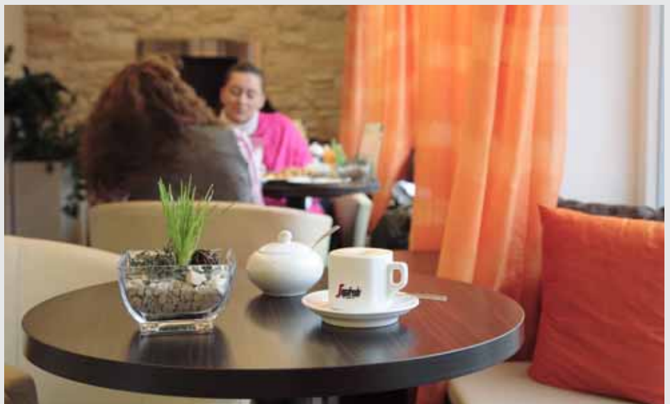
Das Café kommod ist rasch ein beliebter Treffpunkt für Jung und Alt geworden.