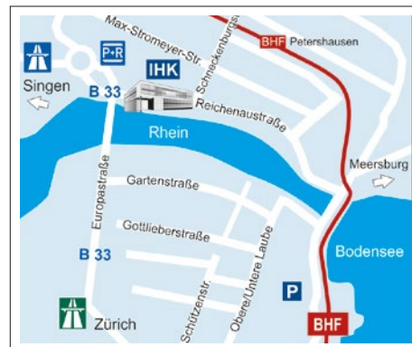
IHK Hochrhein-Bodensee, Konstanz