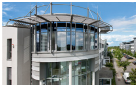
TPK Technologiepark Karlsruhe GmbH

Wankelstr. 12 70563 Stuttgart Tel. 0711 686894-0 Fax 0711 686894-110 www.step-gmbh.com