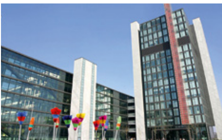
STEP Stuttgarter Engineering Park GmbH

In über zehn Jahren haben wir über 500 Mio. Euro investiert und rund 290 Unternehmen mit über 9.200 Mitarbeitern angesiedelt. Wir bieten Ihnen Nutzungen vom Start-up-Einzelschreibtisch über Büros bis hin zum Labor mit höchstem Reinraumstandard. Mit unserer Standortentwicklung engagieren wir uns in Karlsruhe, Stuttgart, Tübingen und Reutlingen.