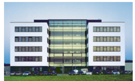
TTR Technologieparks Tübingen-Reutlingen GmbH

Albert-Nestler-Str. 15 76131 Karlsruhe Tel. 0721 6105-01 Fax 0721 6105-199 www.techpark.de