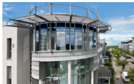
TPK Technologiepark Karlsruhe GmbH

Wankelstr. 12 70563 Stuttgart Tel. 0711 686894-0 Fax 0711 686894-110 www.step-gmbh.com