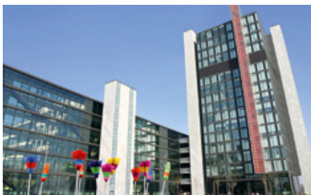
STEP Stuttgarter Engineering Park GmbH

In über zehn Jahren haben wir über 500 Mio. Euro investiert und rund 290 Unternehmen mit über 9.200 Mitarbeitern angesiedelt. Wir bieten Ihnen Nutzungen vom Start-up-Einzelschreibtisch über Büros bis hin zum Labor mit höchstem Reinraumstandard. Mit unserer Standortentwicklung engagieren wir uns in Karlsruhe, Stuttgart, Tübingen und Reutlingen.